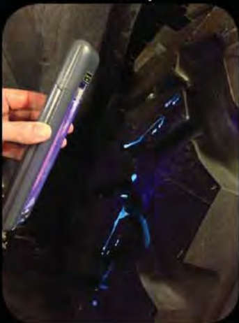
Grieta en un rin identificada Por Sentry